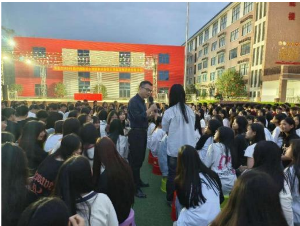
图2.2-5:2024年3月27日，团市委到我校开展2024年贵港市“防校园欺凌”心理健康暨无偿献血知识进校园讲座活动。