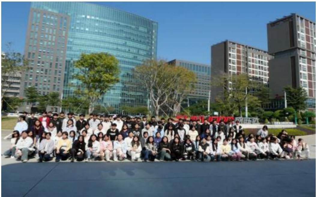
图3.1-1：2024年电子商务、汽修专业学生在欣旺达实习