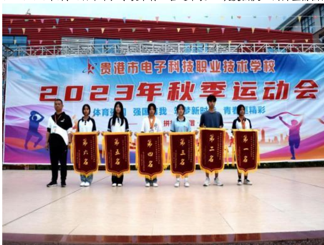
图2. 2-2:2023年11月21日—23日学校举行“体育强国 强国有我 筑梦新时代 青春更精彩”2023年秋季运动会