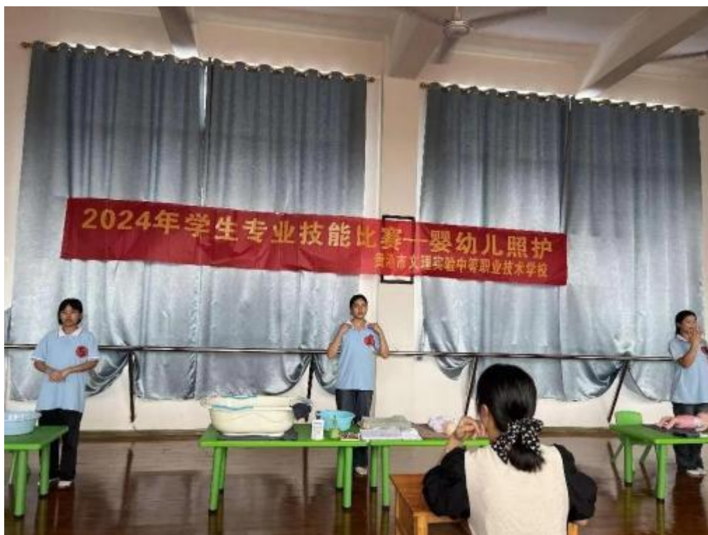
图2.6-8：2024年6月14日，2024年学生专业技能大赛-婴幼儿照护