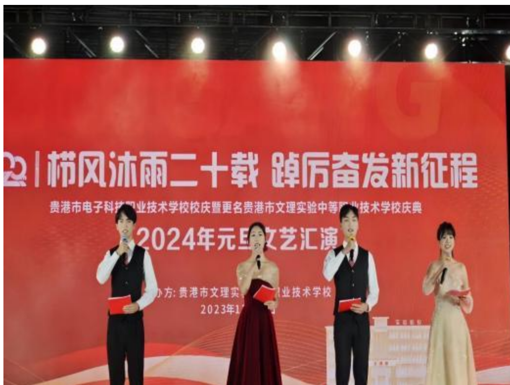
图2. 2-3: 2023年12月28日学校举行了“栉风沐雨二十载 踔厉奋发新征程”校庆暨更名庆典文艺晚会