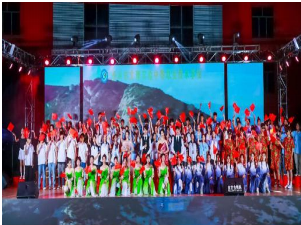
图2.2-8: 2024年6月19日学校举办了以“与党同心 跟党走——青春为中国式现代化挺膺担当”为主题的文艺晚会活动。