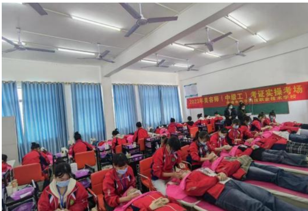
图2.5-2：2023年12月23日美容师考证