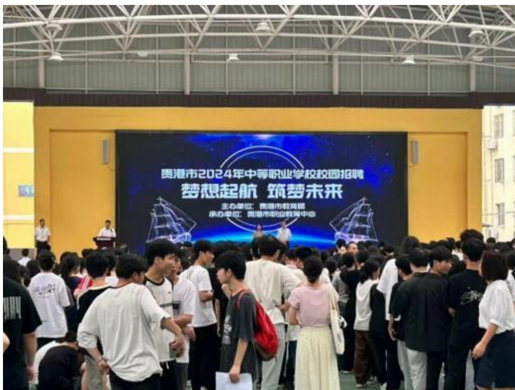
图2.4-3：2024年4月我校毕业生参加贵港市中等职业学校校园招聘