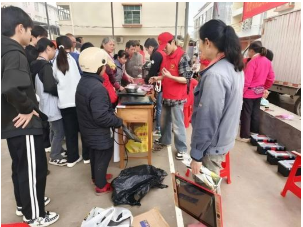
图3.2-2：2024年3月15日，学校党支部组织师生代表到贵港市高新区西江农场四队开展义务技术服务