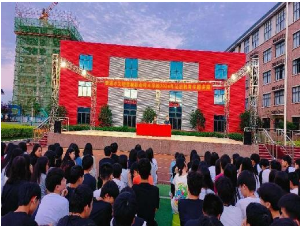
图2.2-7:2024年5月20日,我校进行了主题为“与法同行,健康成长”的法治教育专题讲座。