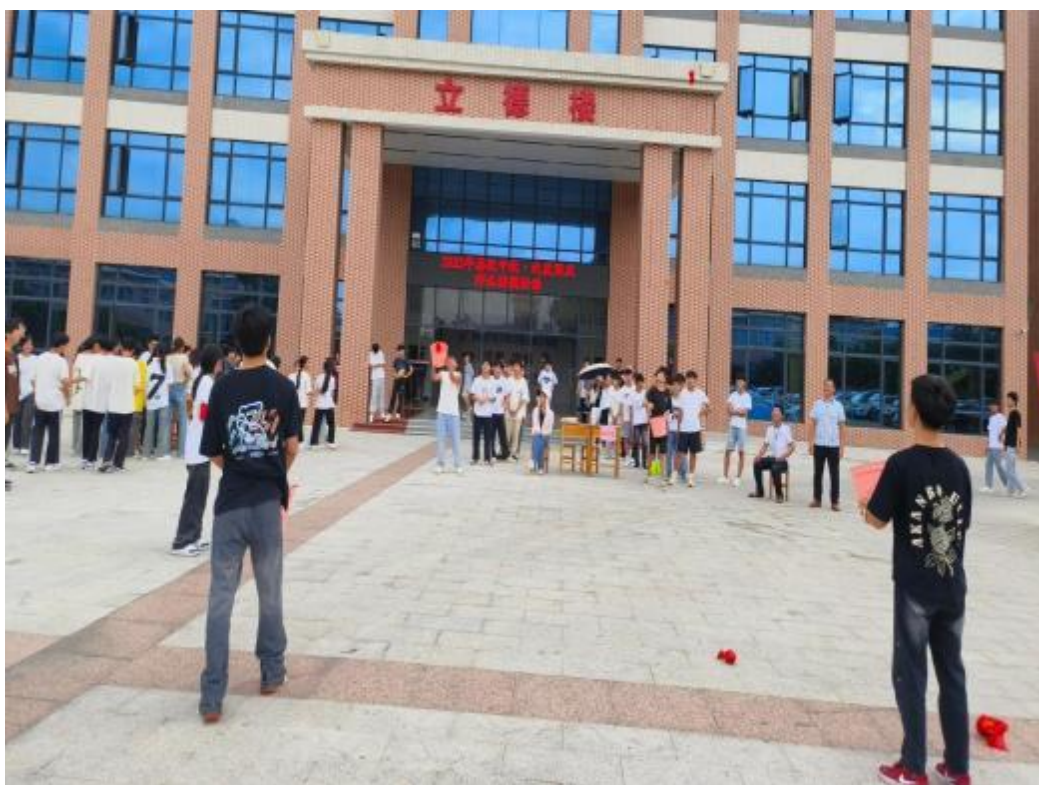
图2. 2-1:2023年9月26日下午，学校举行“喜迎中秋 · 欢度国庆”的师生游园活动