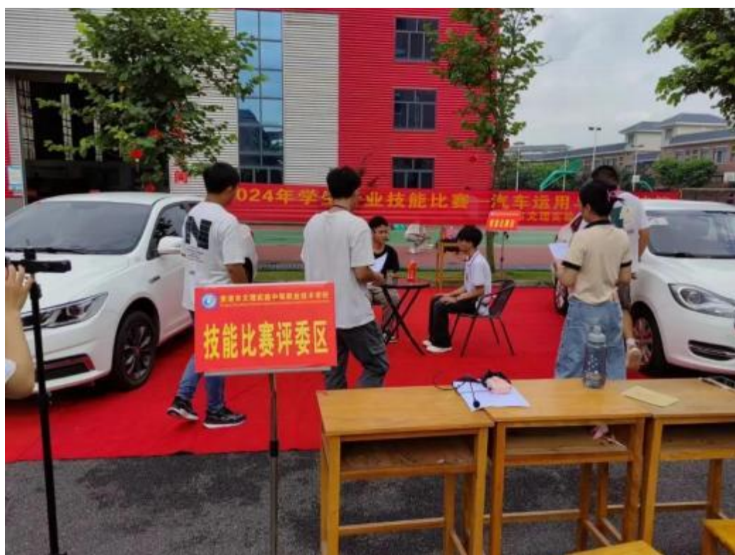
图2. 6-7：2024年6月14日，2024年学生专业技能大赛-汽车营销