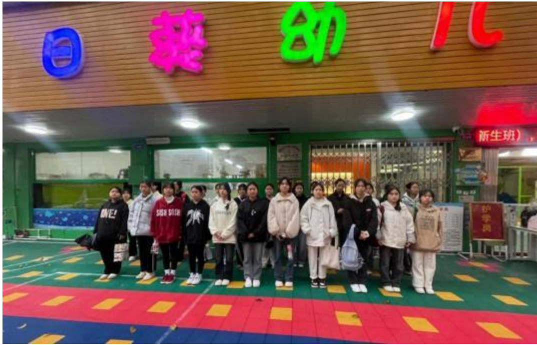
图3.1-3：2024年3月15日幼儿保育专业学生在幼儿园实习