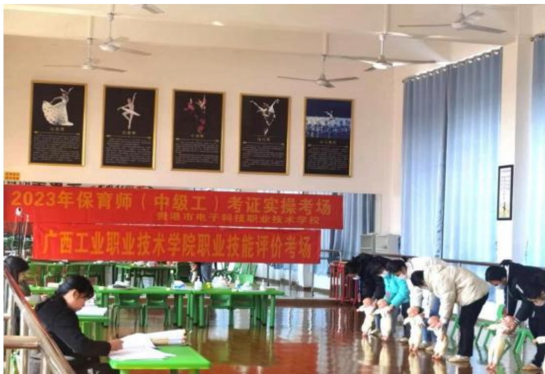
图2.5-1：2023年12月23日保育师考证

学校积极响应国家创新驱动发展战略，推进“大众创业，万众创新”，立足于中职学生的职业需求，加快培养创新创业人才。学校积极开展对学生的创新创业能力的培养。开启以创新创业教育为导向的“育人”教学模式，以育人为核心，结合校内外资源，为学生提供创业实践条件和技术支持，培养出具有专业知识和技能的创新型人才。在2024年学生参加职业技能等级证书考证前邀请行业企业及相关考证专业老师为学生进行培训，有序推进汽车运用与维修、美容师、保育师职业技能等级证书的考证工作，不断优化评价内容，改变评价方式，建立课证融通的评价机制，多维度评价学生的专业知识和技能水平。