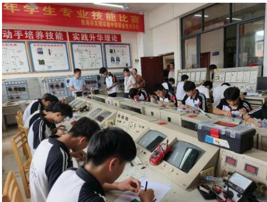
图2.6-3：2024年6月14日，2024年学生专业技能大赛-电子电路装调