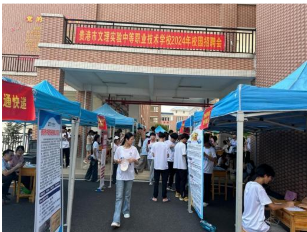
图2.4-4：2024年7月我校毕业生参加本校校园招聘会