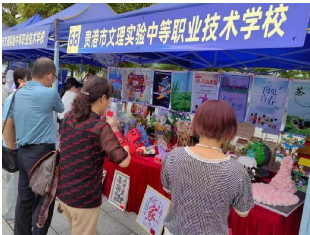
图3.2-3：2024年5月21日学校参加贵港市职业教育活动周