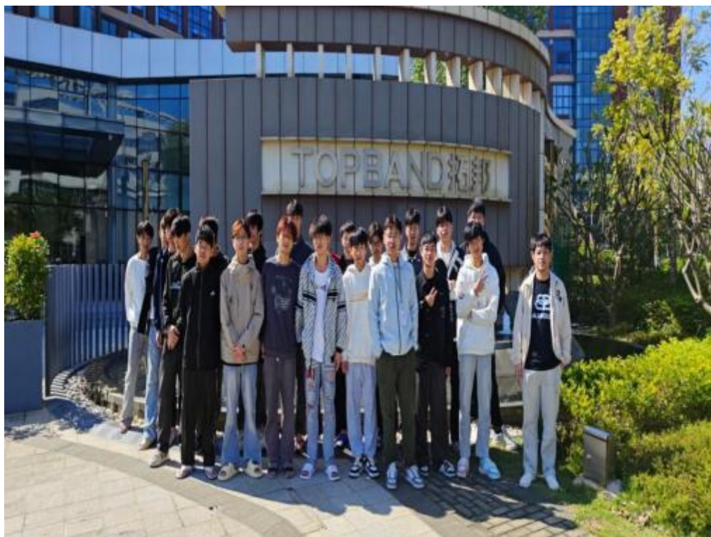
图3.1-2：2024年汽修、计算机专业学生在拓邦实习