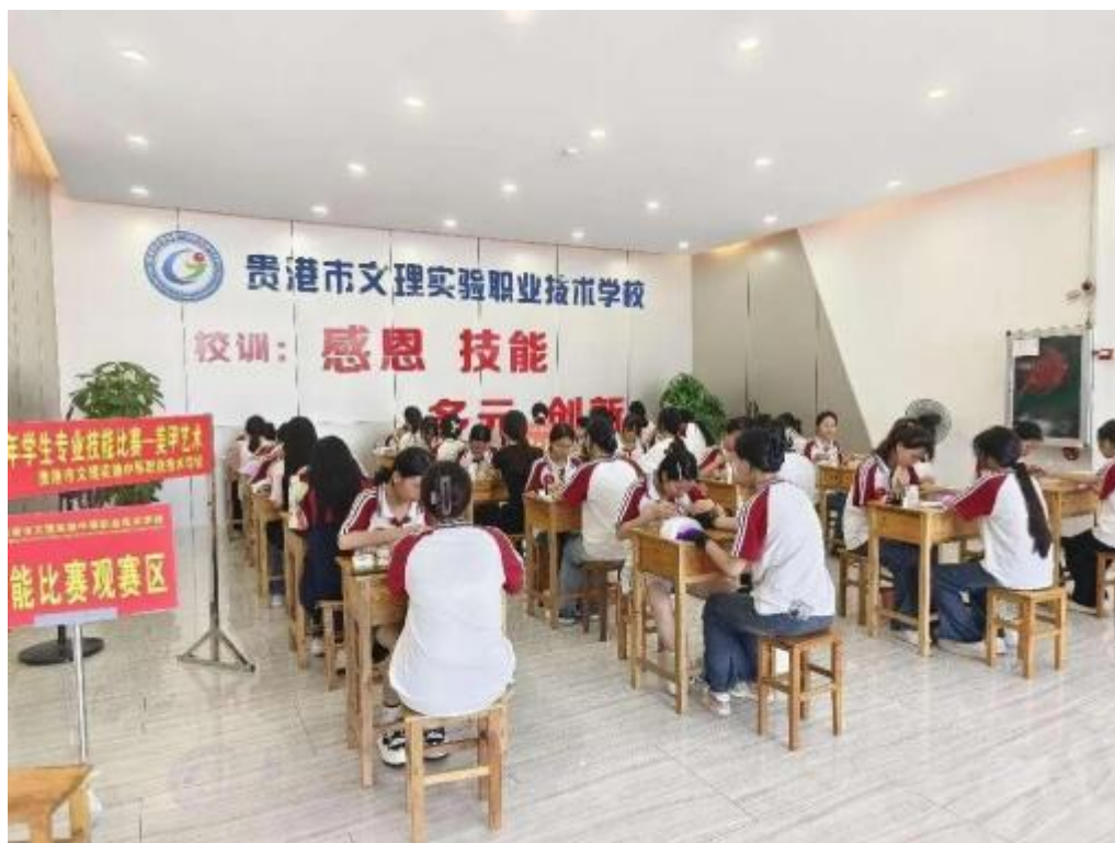
图2. 6-6：2024年6月14日，2024年学生专业技能大赛-美甲艺术