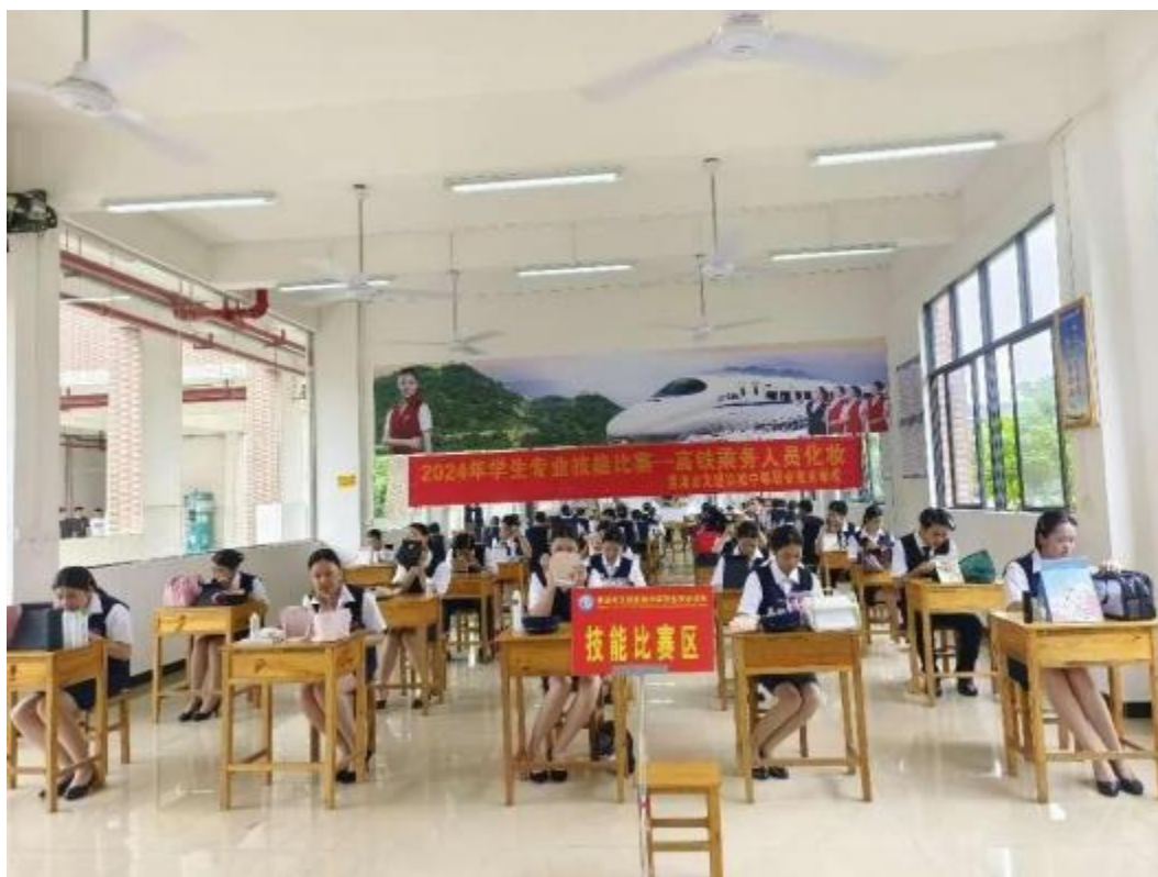
图2.6-4：2024年6月14日，2024年学生专业技能大赛-高速铁路乘务