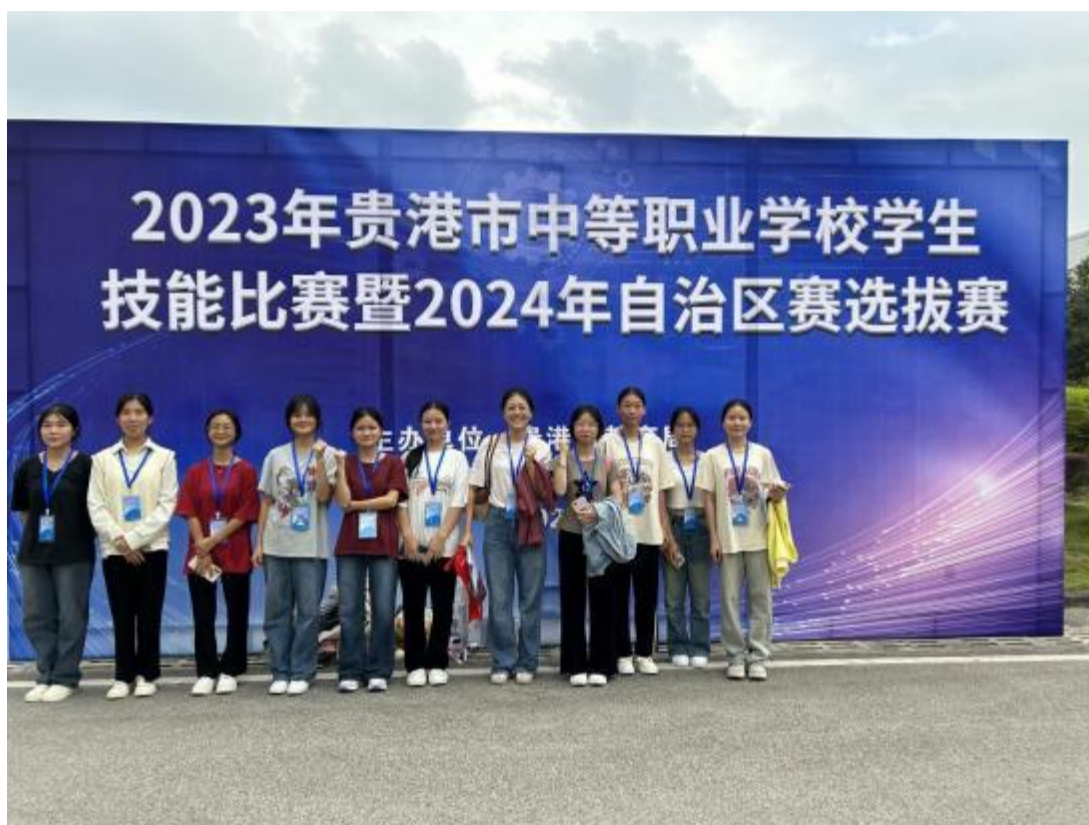
图2.6-1：2023年贵港市中职学生技能比赛暨2024年自治区选拔赛

2. 组织学生参加“技能成才 强国有我”主题教育活动，获得一等奖 1 个，二等奖 4 个，三等奖 22 个。