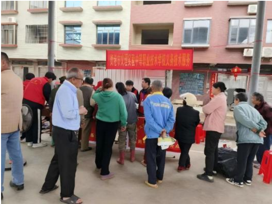
图3.2-1：2024年3月15日，学校党支部组织师生代表到贵港市高新区西江农场四队开展义务技术服务