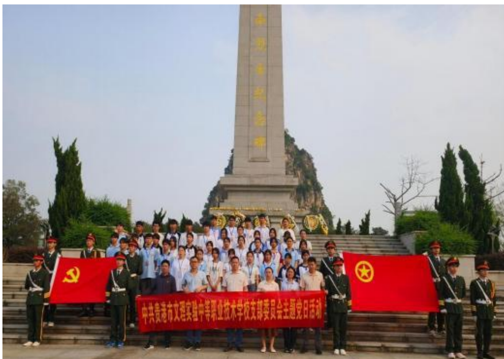
图2.2-6:2024年4月2日上午，我校党支部组织师生到南山寺革命烈士纪念碑进行主题为“清明祭英烈 共铸中华魂”的祭扫活动。