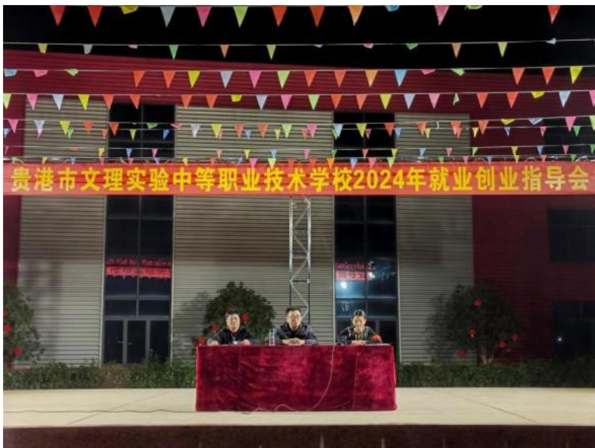
图2.4-2：2024年4月学校开展就业、创业专题讲座教育

组织学生参加2024年贵港市中等职业学校校园招聘会及我校举办的校园招聘会，需就业的学生在指导老师的带领下，让学生多方面了解就业形势、人才需求情况、招聘程序等，选择与自身专业匹配度较高的就业机会。