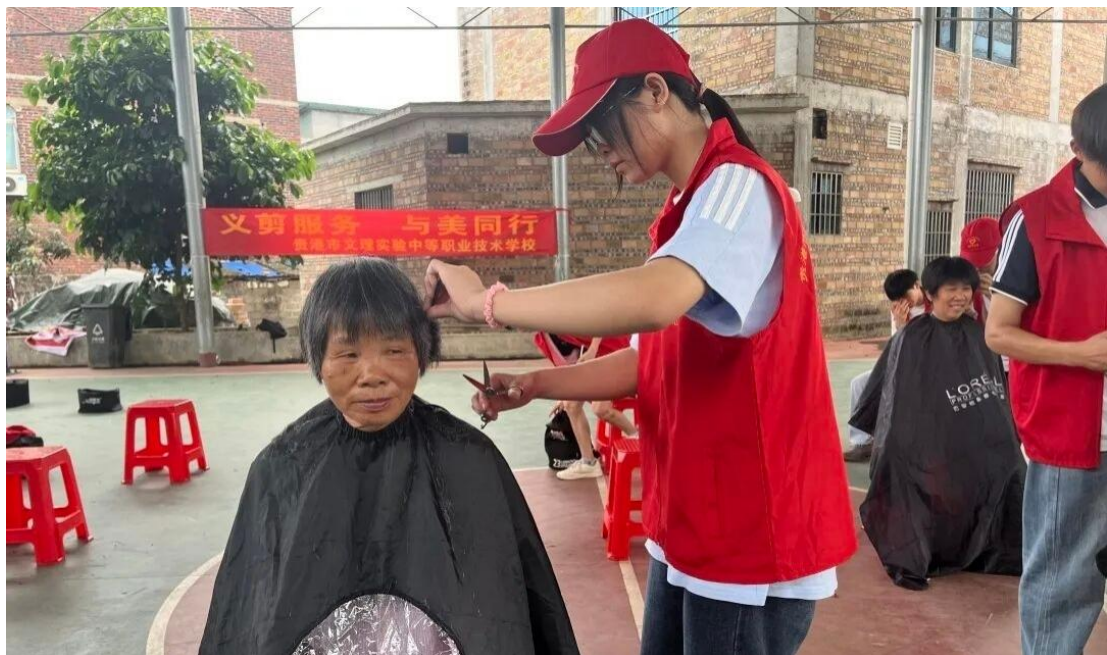
图 3.2-2：2025 年 6 月 12 日美容美发与形象设计专业为社区开展美发志愿服务