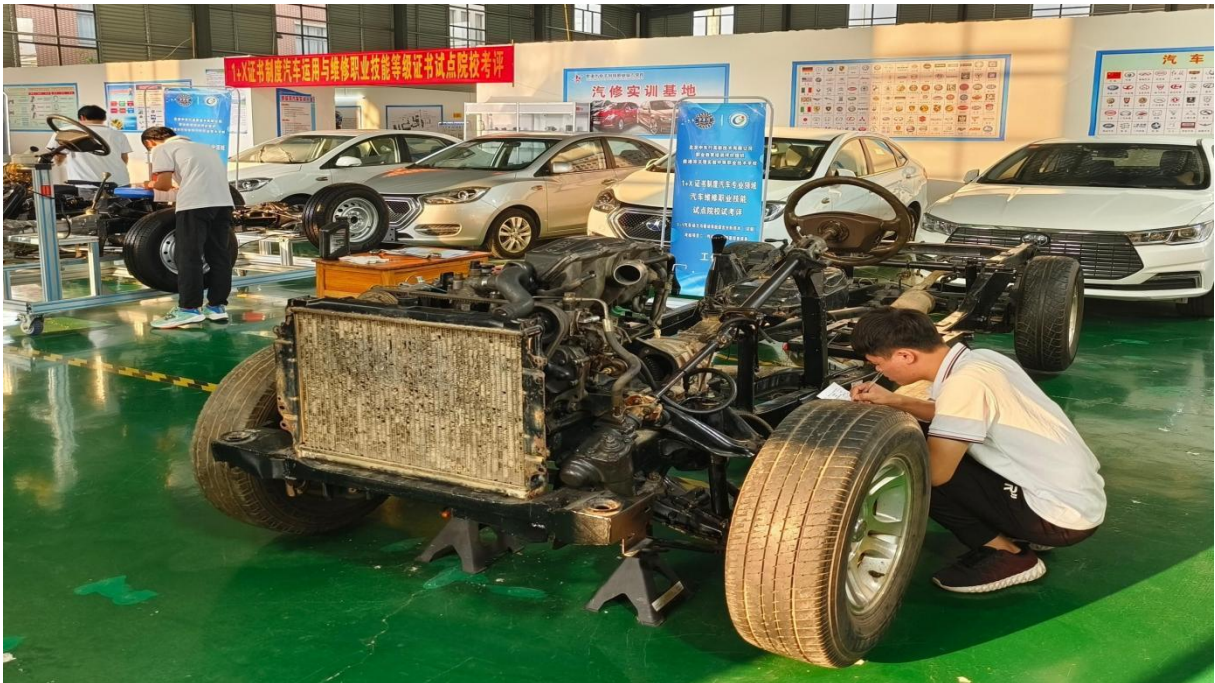
图 2.7-1: 2024 年 11 月 14-16 日举行 1+X 证书考证

(二) 技能比赛举办及参赛情况: 学校 2025 年 6 月举办了一次校级专业技能比赛, 2024 年 11 月参加了贵港市教育局举办的 2024 年贵港市中职学生技能比赛暨 2025 年自治区选拔赛。