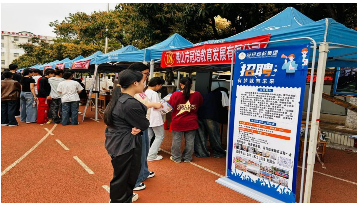
图 2.9-2：2025 年 4 月 7 日我校毕业生参加贵港市中等职业学校校园招聘