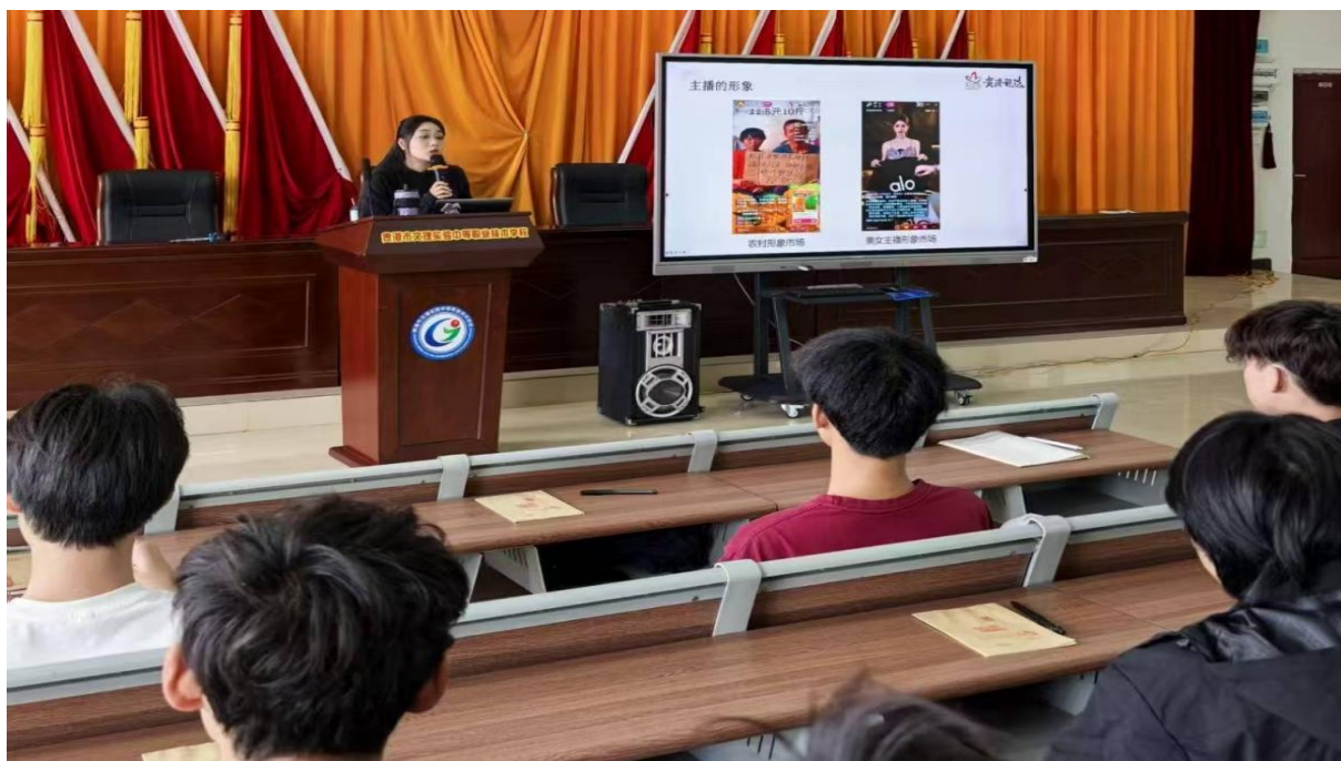
图 2.9.2-1：2025 年 4 月 24 日贵港甄选主播来我校进行培训