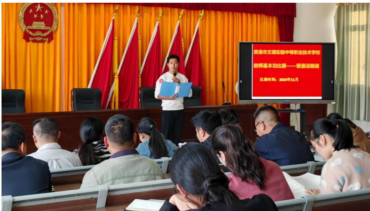
图2.1-6：2024年11月举行教师基本功比赛