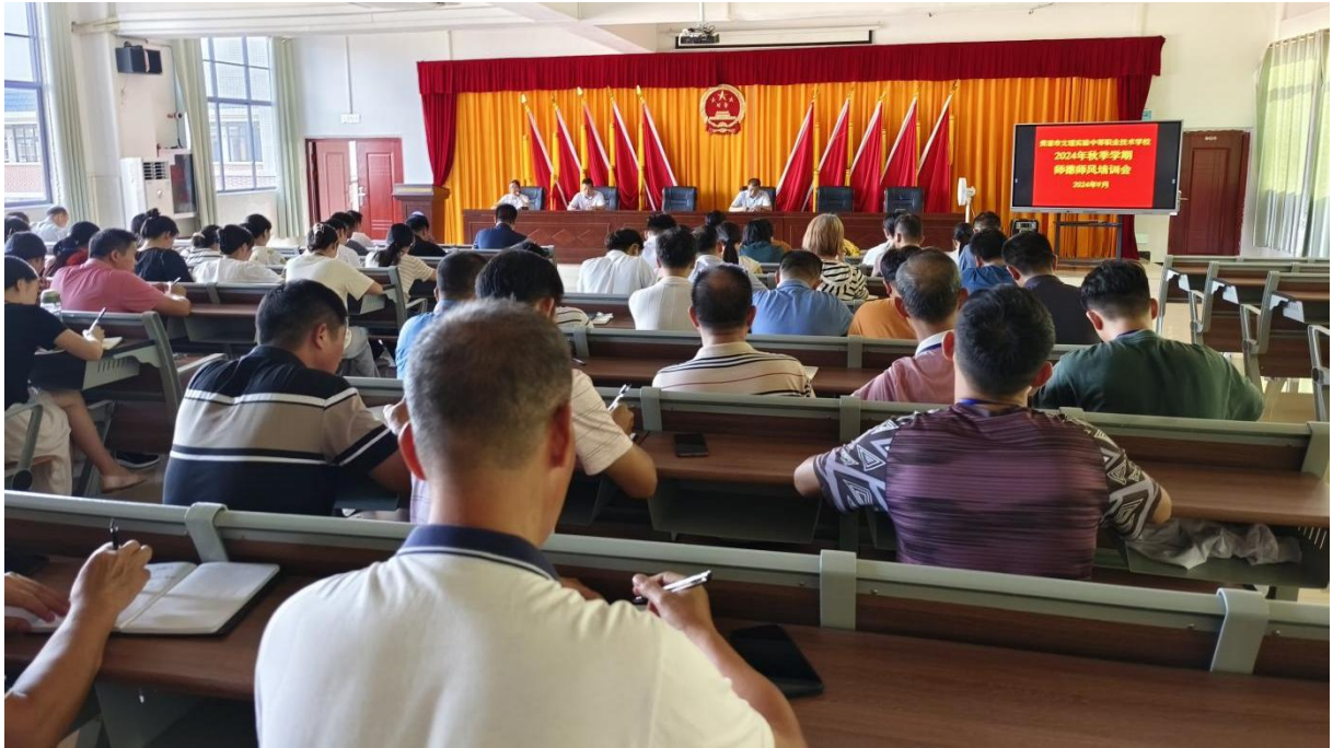
图 2.5-7：2024 年 9 月 2 日进行 2024 年秋季学期师德师风培训