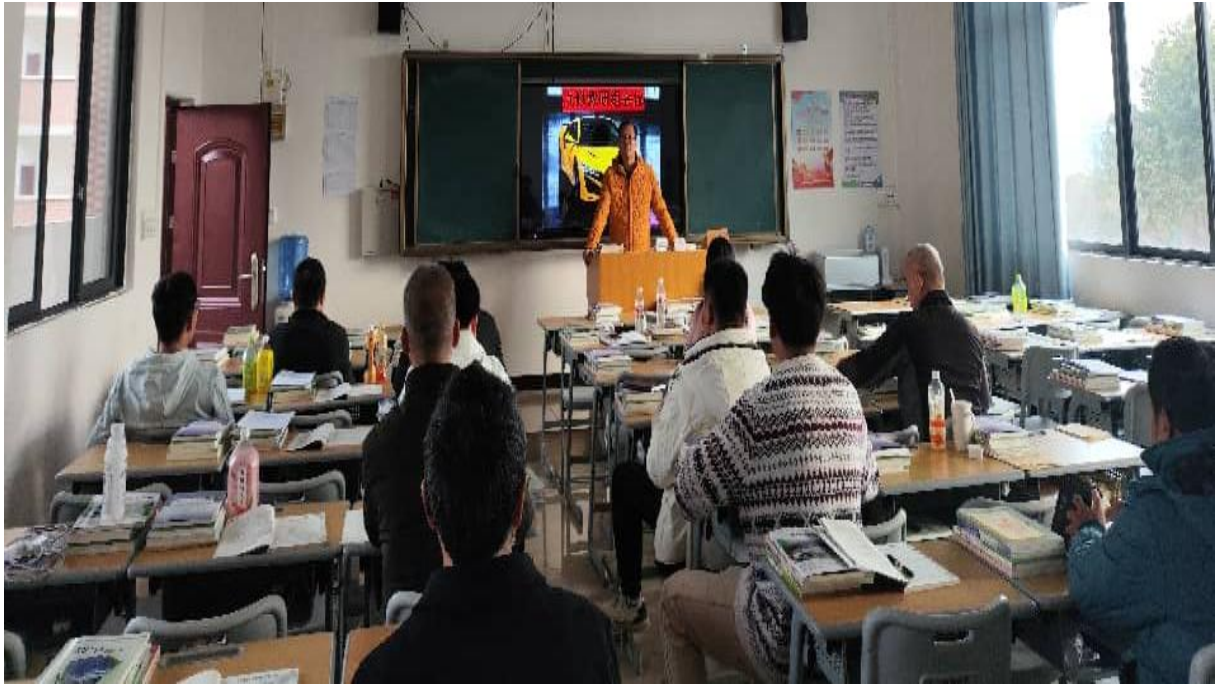
图 2.5-3：2024 年 12 月 19 日汽车运用与维修专业教研组召开教研会议讨论期末工作