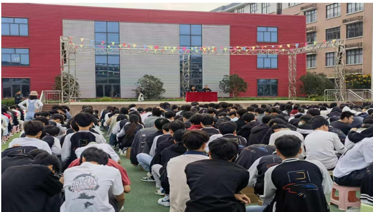
图 2.9-1：2025 年 3 月 26 日学校开展就业、创业专题讲座教育