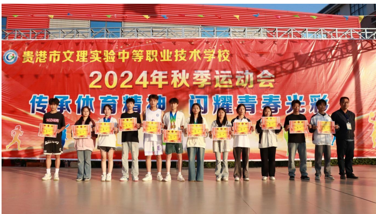
图2.1-5：2024年11月19-21日举行“传承体育精神 闪耀青春光芒”秋季运动会