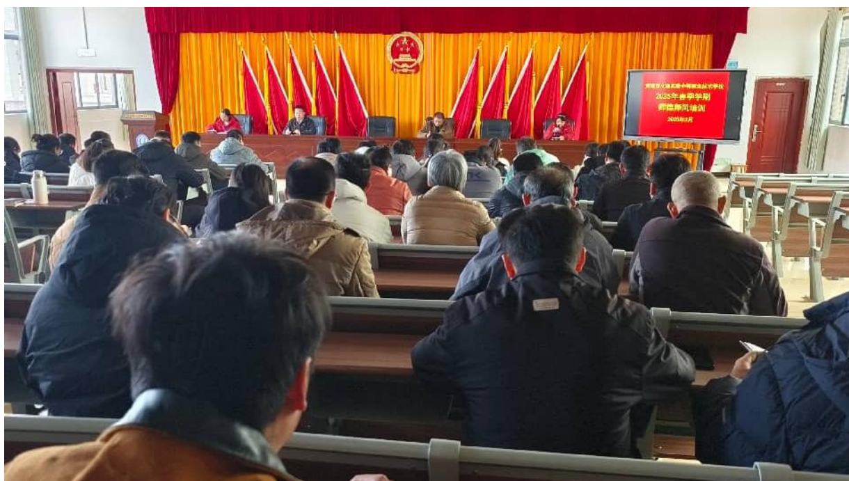
图 2.5-10：2025 年 2 月 24 日进行 2025 年春季学期师德师风培训