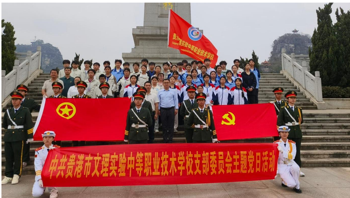
图 2.1-14：2025 年 3 月 28 日开展“缅怀革命先烈 赓续红色血脉共筑中华魂”为主题的清明祭扫活动