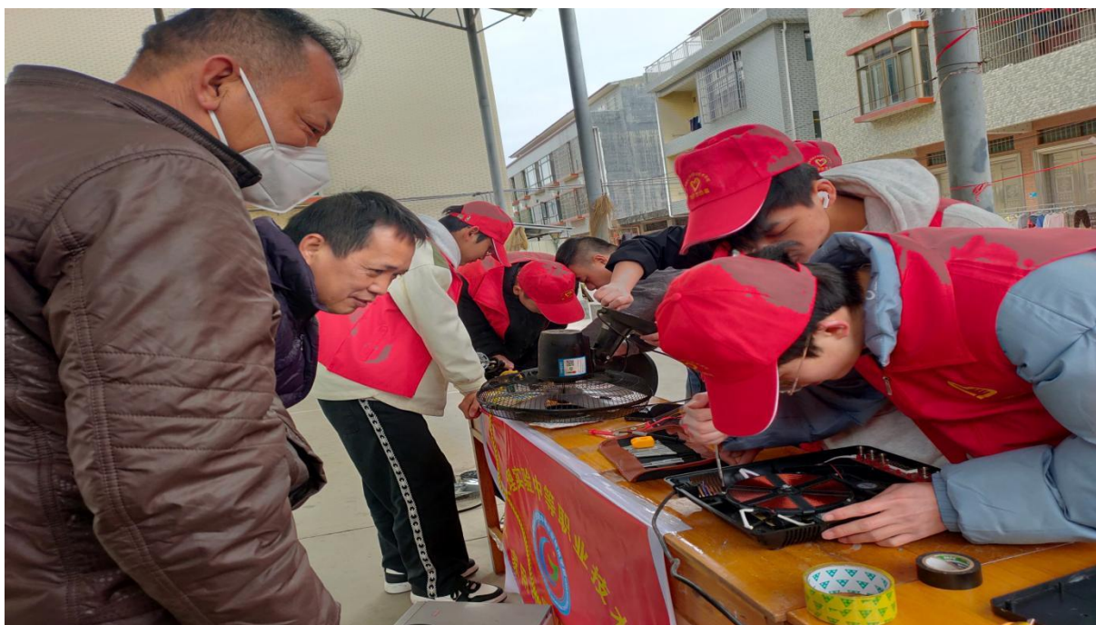
图 2.1-10：2025 年 3 月 6 日开展主题“践行雷锋精神·绽放时代光芒”学雷锋活动