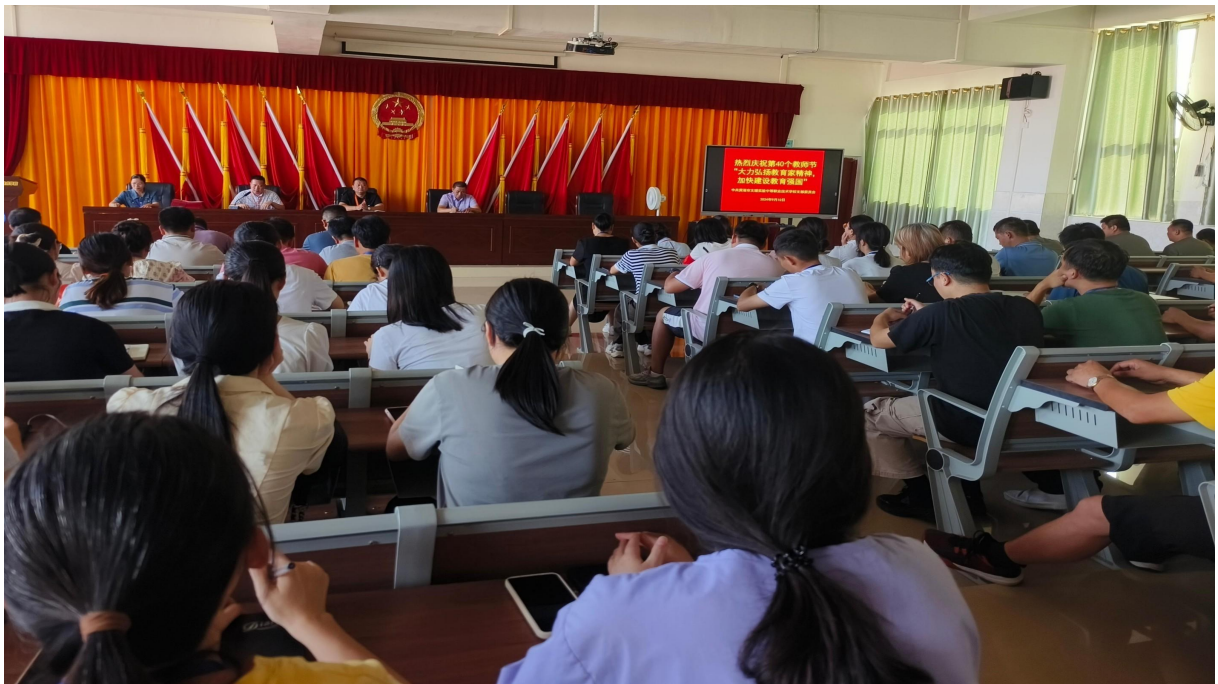
图 2.5-8：2024 年 9 月 10 日开展“弘扬教育家精神 加快建设教育强国”主题教师节活动