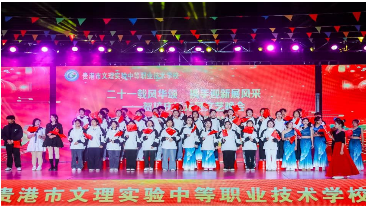
图 7-4：2025 年 12 月 6 日党建带团建“文艺晚会活动”