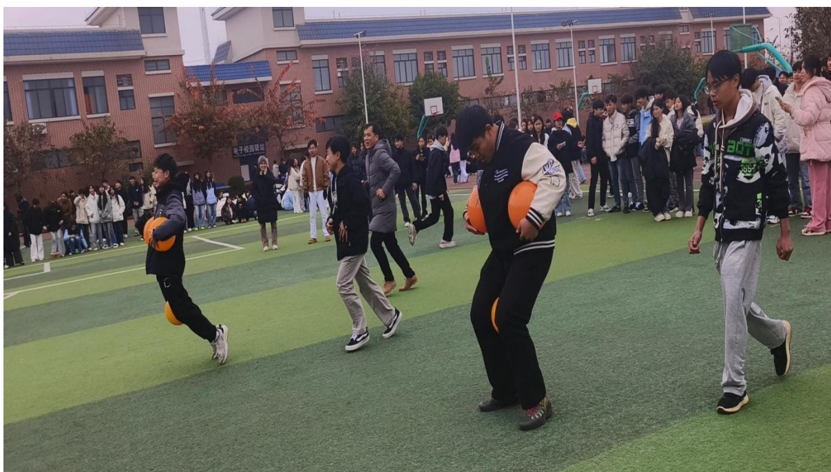
图2.1-11：2025年3月7日开展主题为“芳华绽校园 巾帼谱新篇”三八节的师生文体活动