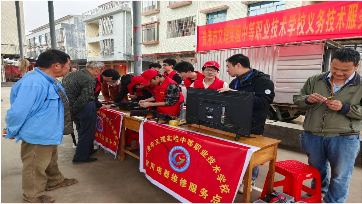
图 7-3：2025 年 3 月 6 日党建带团建“学雷锋活动”