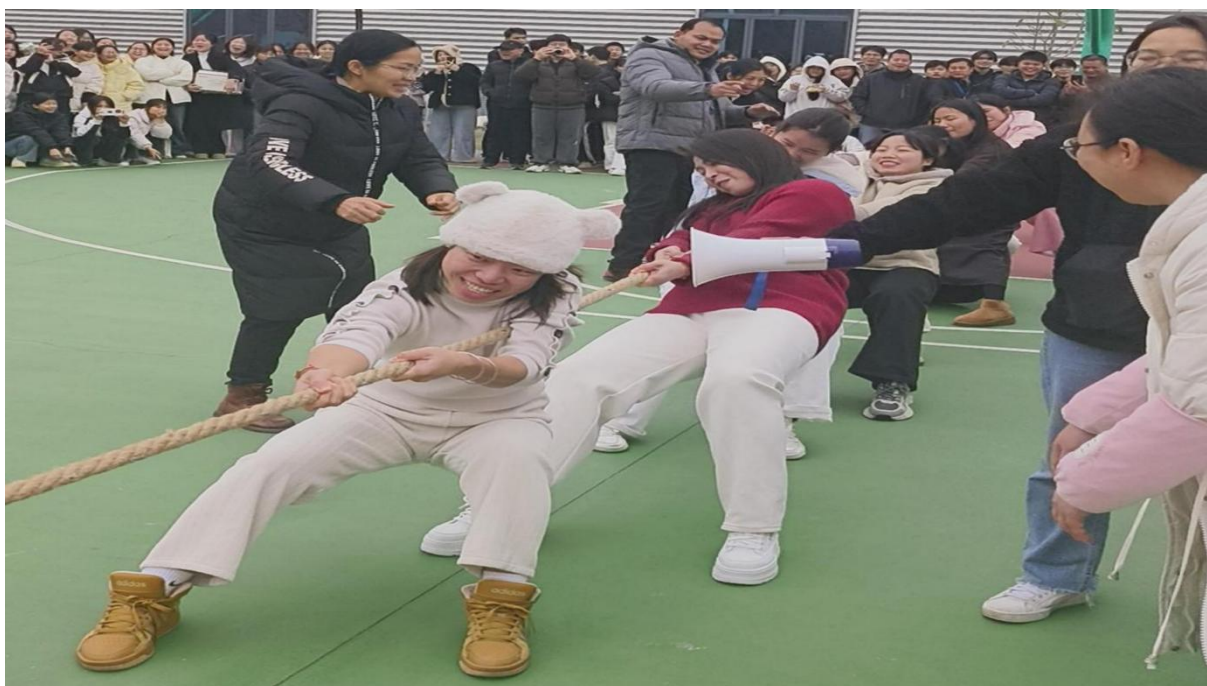
图 2.8.1-2: 2025 年 3 月 7 日开展主题为“芳华绽校园 巾帼谱新篇”三八节的师生文体活动