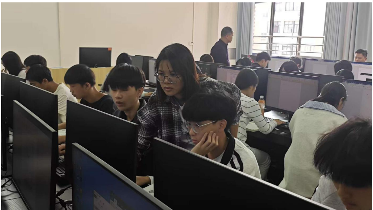
图 2.5-6：2025 年 3 月开展 2025 年春季学期教师公开课活动

广泛开展师德师风建设活动，弘扬社会主义核心价值观。积极组织开展了师德师风培训、师德师风警示教育及师德师风考核等活动。要求我们的教师严格按照文件精神，恪守教师职业道德，不断提高自身师德自觉性，切实肩负起立德树人、教书育人的光荣使命和神圣职责。