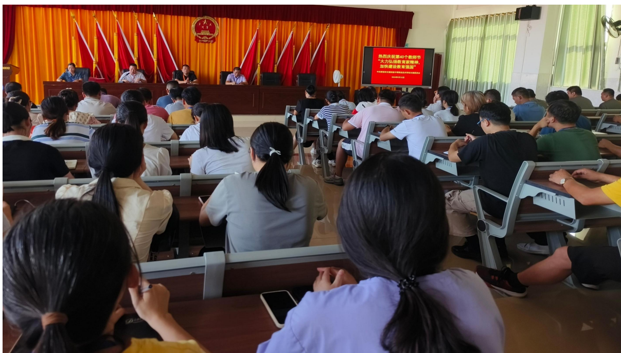
图 2.1-2：2024 年 9 月 10 日开展“弘扬教育家精神 加快建设教育强国”主题教师节活动 动