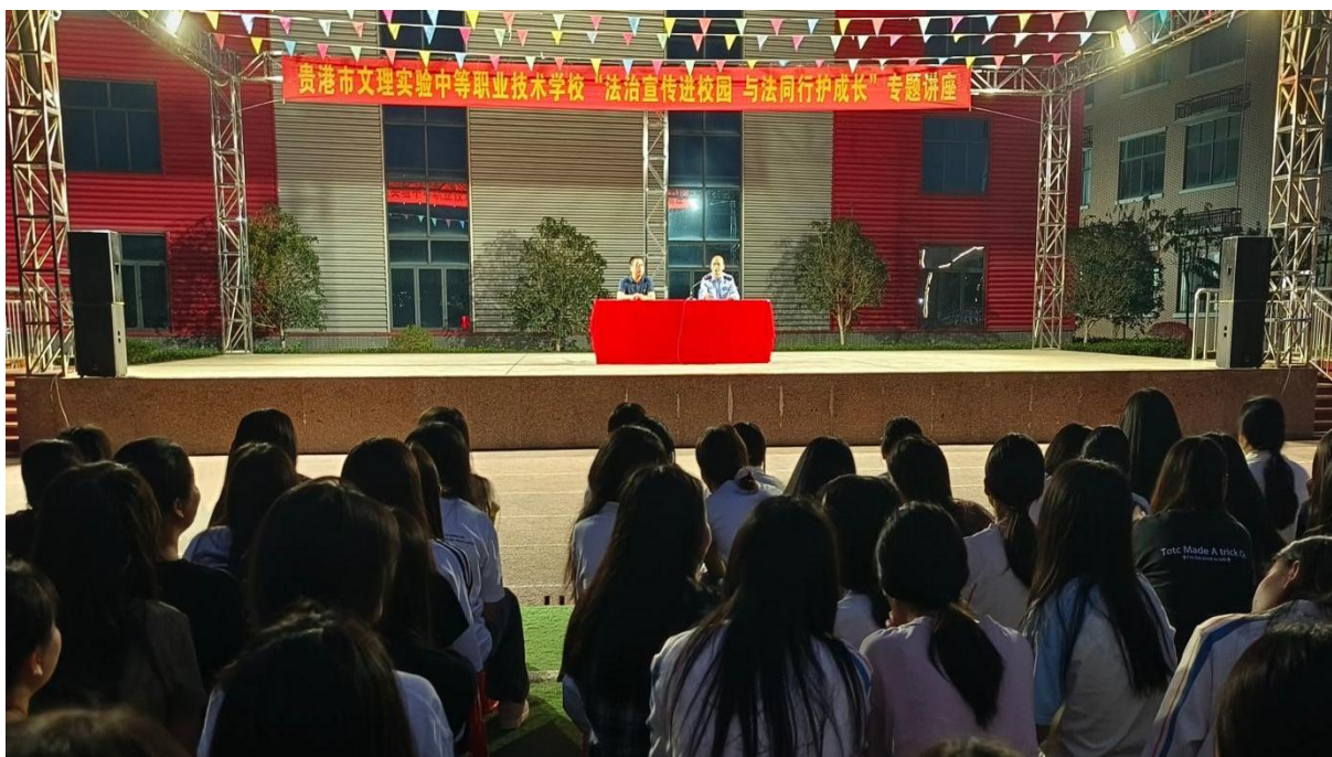
图 2.1-12：2025 年 3 月 26 日开展“法治进校园 与法同行护成长”的法治主题教育活动