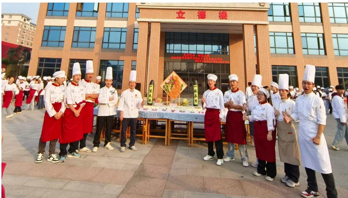
图 2.1-8：2025 年 1 月 7 日举行中西面点专业“美食艺术 创意无限”——作品展示