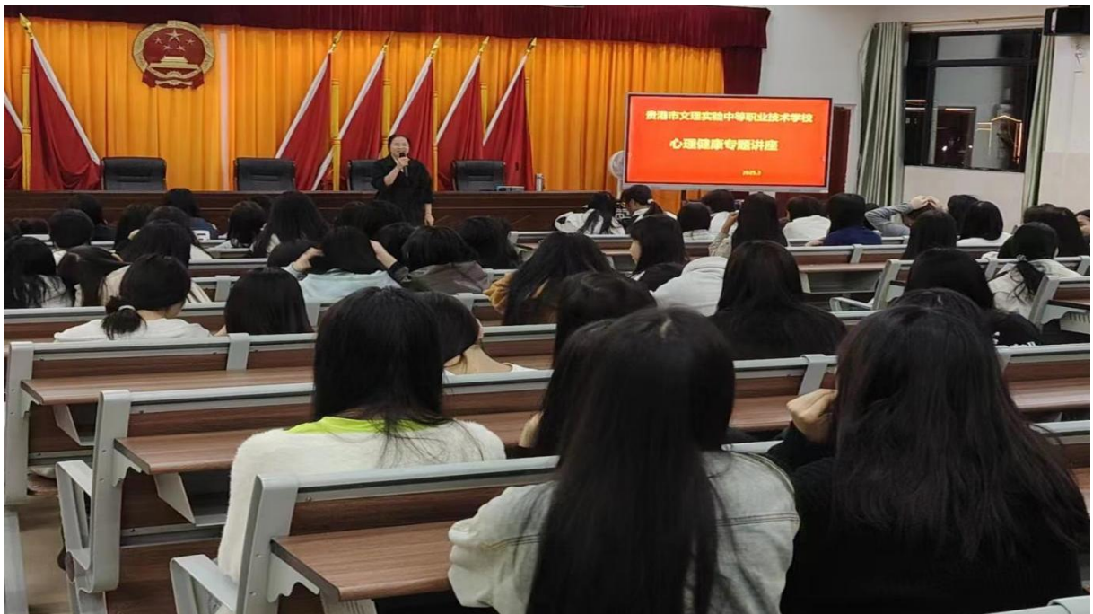
图 2.8.4-2：2025 年 3 月 20 日召开女生心理专题会议