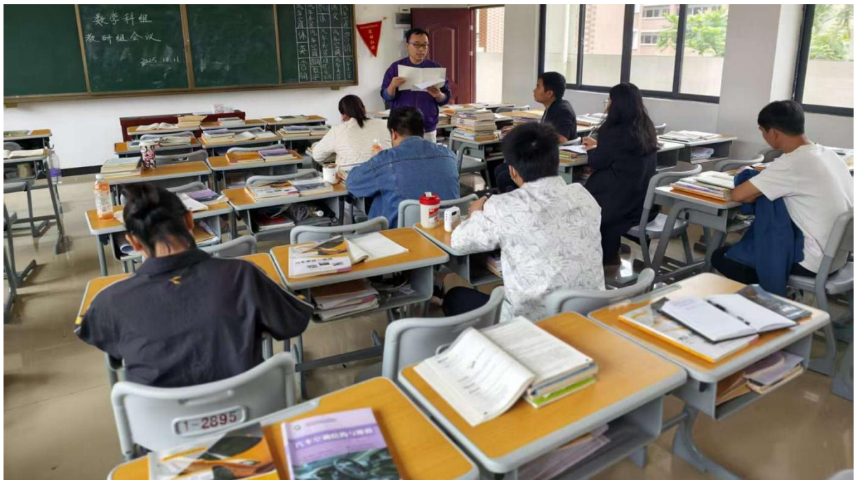
图 2.5-4：2025 年 3 月 13 日数学科组召开教研会议讨论课堂教学情况

开展了教师教学公开课说课比赛、教师示范课比赛，推动了教师教育教学能力的不断提升。