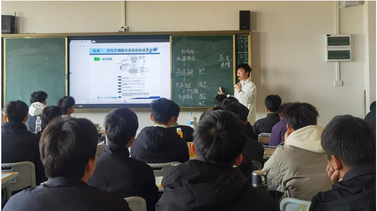
图 2.5-5：2024 年 12 月 17 日-24 日开展 2024 年教师公开课活动