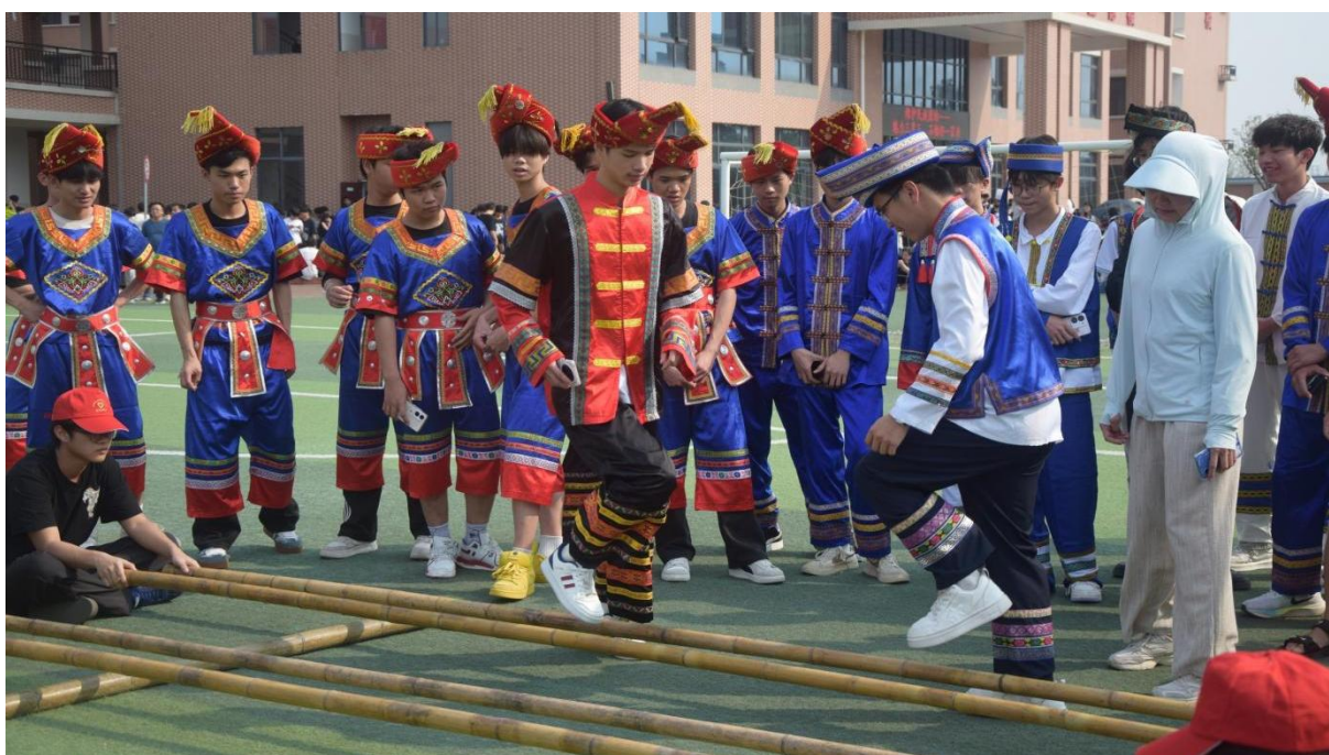
图2.1-13：2025年3月27日举行“潮动三月三 相约在文理”的三月三活动