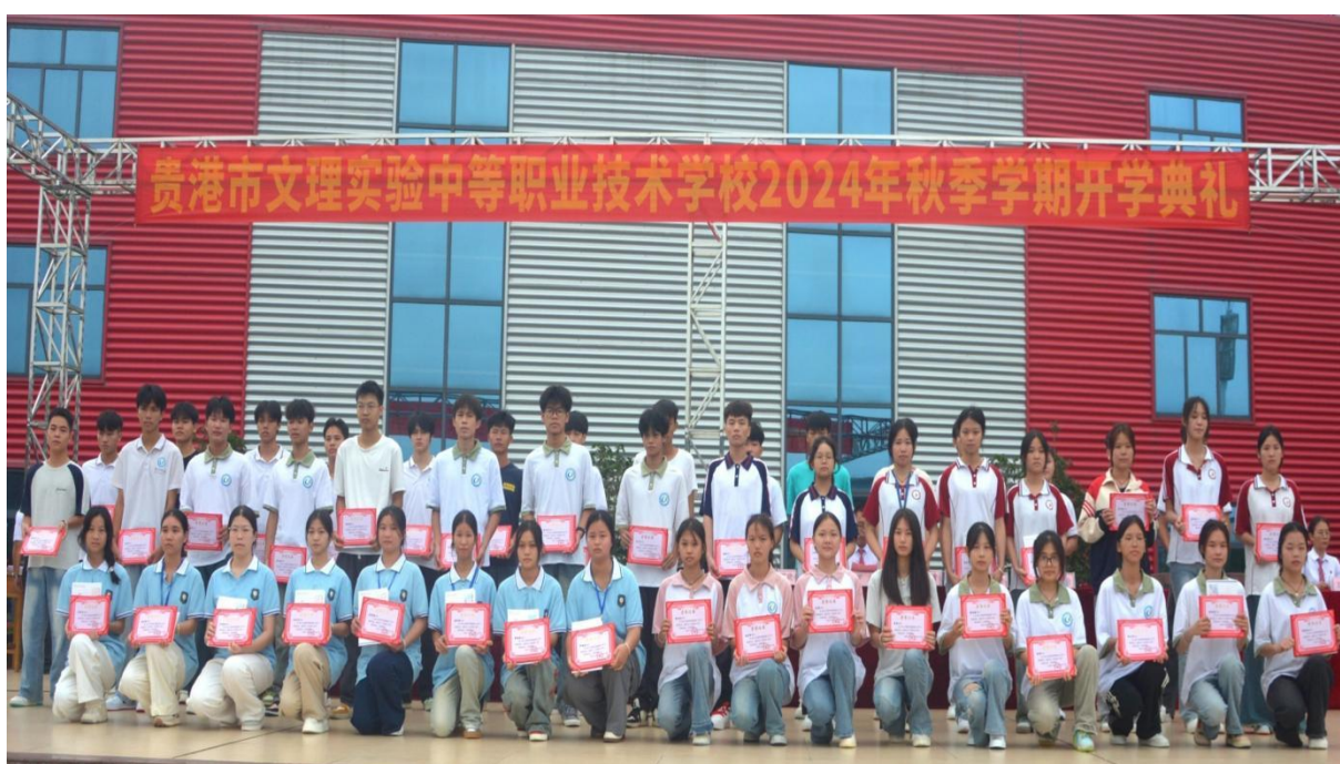
图2.1-1：2024年9月9日“金秋立下鸿鹄志 文理逐梦启新程”秋季开学典礼

术 创意无限——作品展示（中面）”；2025年2月24日“春早远航扬帆起 齐心协力绘新篇”春季开学典礼；2025年3月日学雷锋的“践行雷锋精神·绽放时代光芒”；2025年3月7日“芳华绽校园 巾帼谱新篇”三八节的师生文体活动；2025年3月26日“法治进校园 与法同行护成长”的法治主题教育；2025年3月27日“潮动三月三 相约在文理”三月三活动；2025年3月28日“缅怀革命先烈 赓续红色血脉共筑中华魂”祭扫活动；开展2025年5月14-20日职业教育“一技在手，一生无忧”活动周活动；2025年6月17-18日学校“燃动青春赛道 展现技能风采”专业技能比赛；2025年6月12日“义剪服务与美同行”的志愿活动和义务技术服务活动。