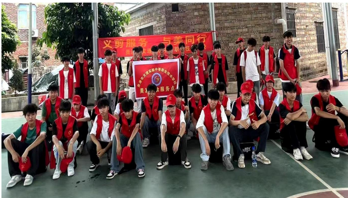
图 2.1-16: 2025 年 6 月 12 日开展主题为“义剪服务 与美同行”的志愿活动和义务技术服务活动