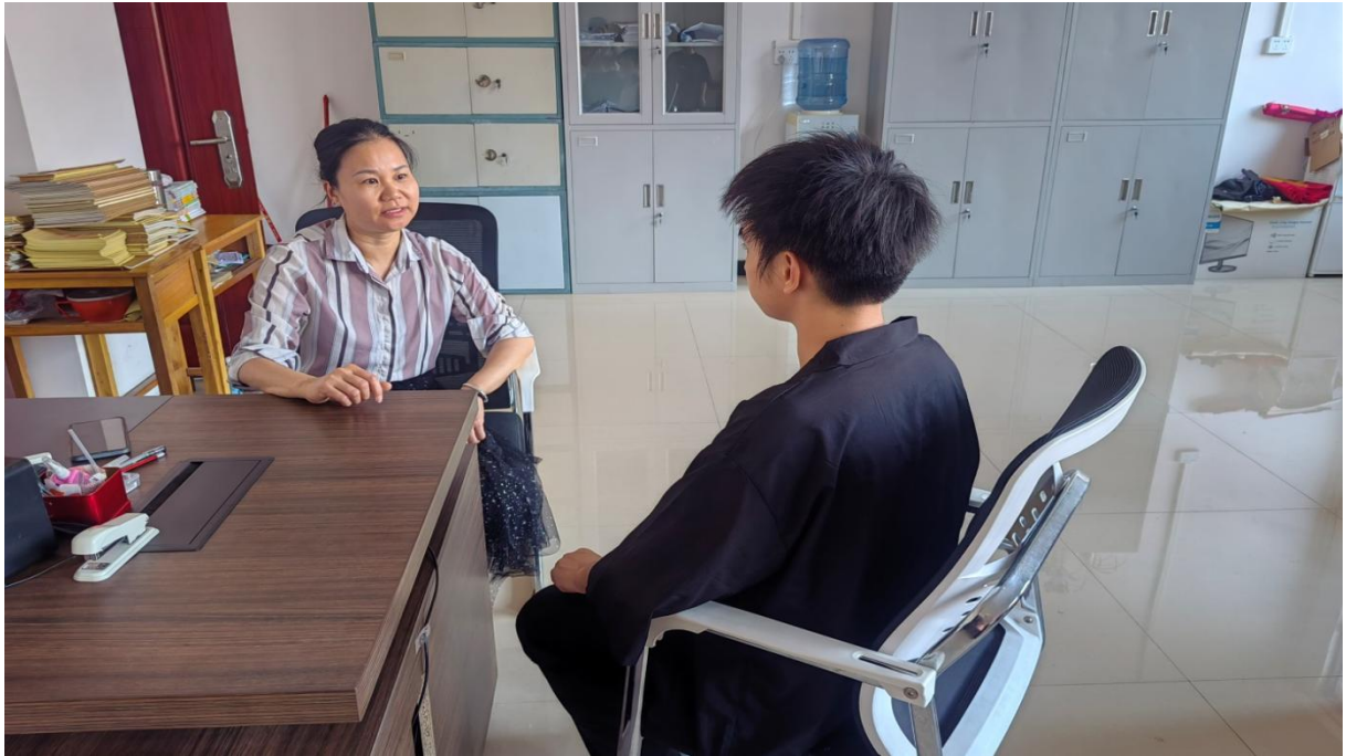
图 2.8.4-1：2024 年 10 月 21 日学校心理教师开导学生