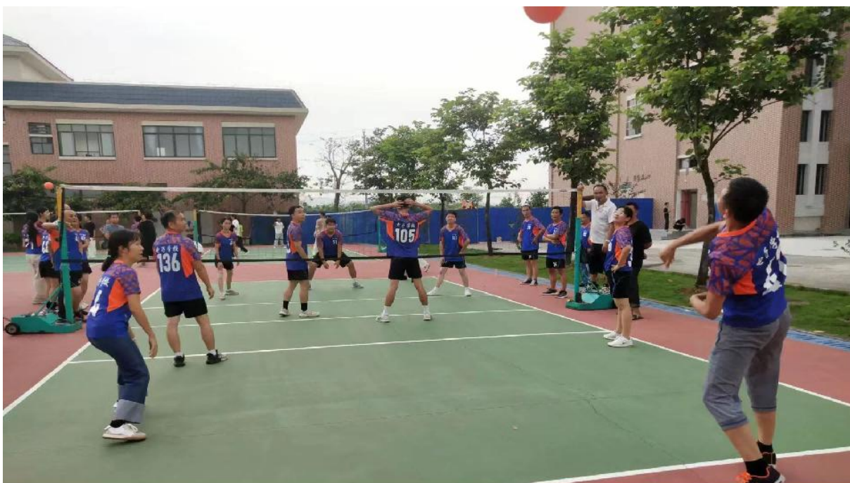
图 2.8.1-1: 2024 年 9 月 9 日, 开展“大力弘扬教育家精神, 加快建设教育强国”教师节活动