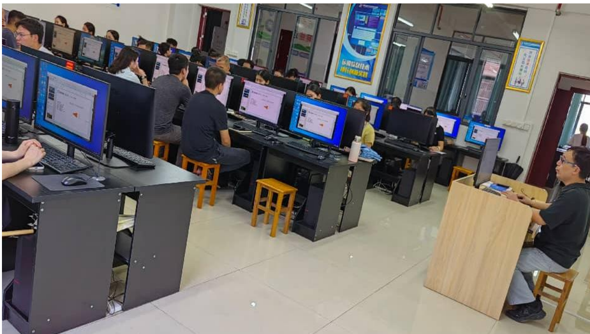
图 2.5-1：2025 年 4 月 23 日组织全体教师学习人工智能技术运用