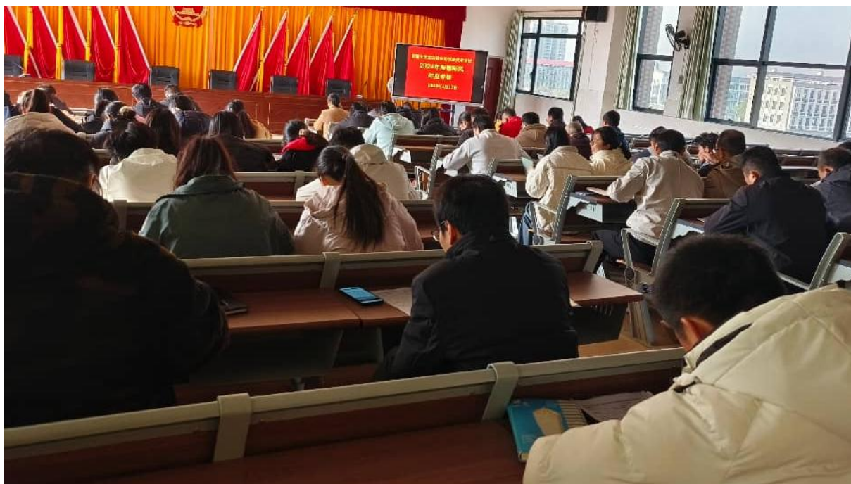
图 2.5-9：2025 年 1 月 17 日进行师德师风考核