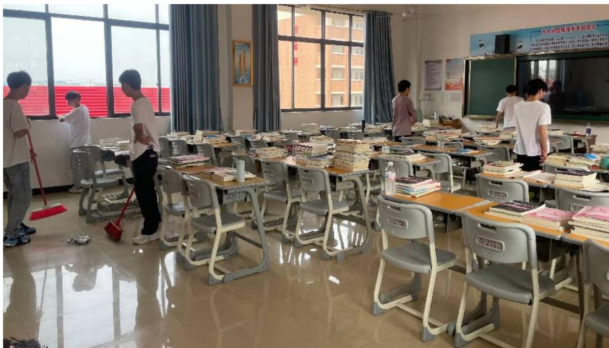
图 2.8.3-2：2024 年 9 月 5 日组织全校开展爱国卫生运动