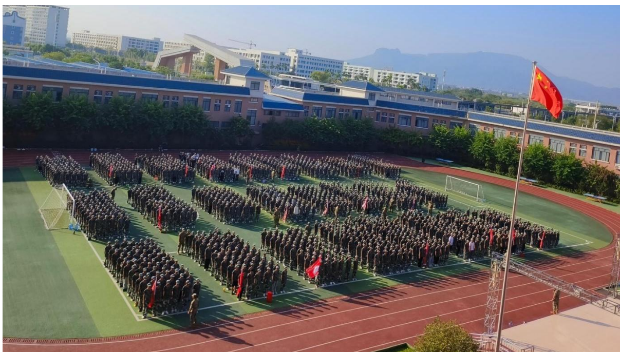
图2.1-3：2024年10月进行新生军训活动