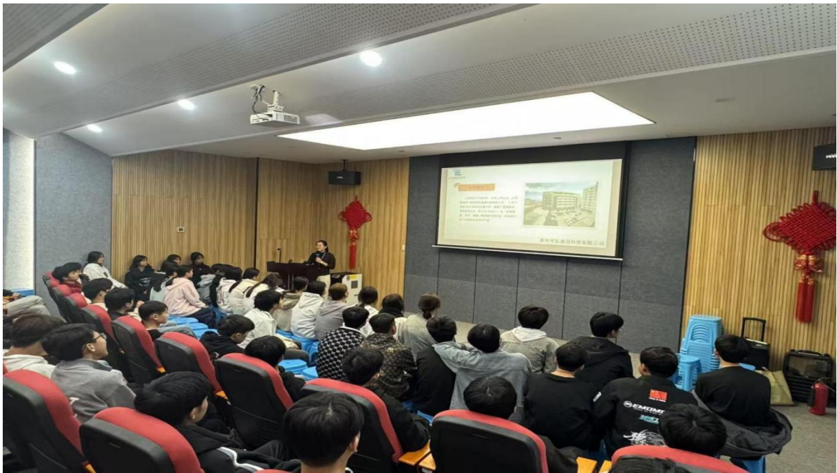
图 3.1-1: 2025 年 10 月 10 日学生在企业实习培训照片