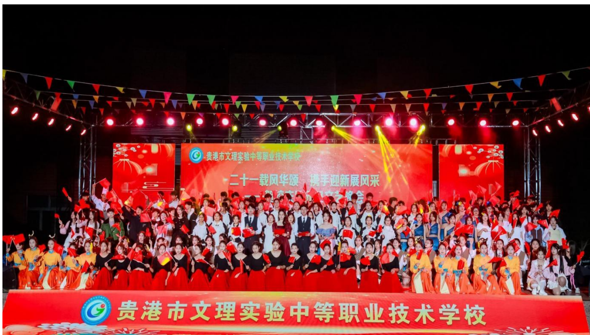
图2.1-7：2024年12月26日举办“二十一载风华颂 携手迎新展风采”庆校庆暨元旦晚会