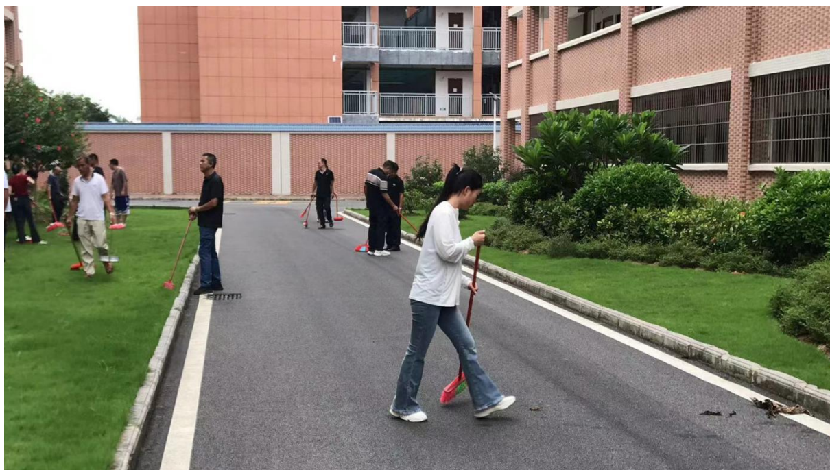
图 2.8.3-1：2024 年 8 月 22 日组织开学前校园清扫活动

明宿舍评比活动；开展爱国卫生月活动；组织校内卫生清扫等，培养学生养成良好卫生习惯。