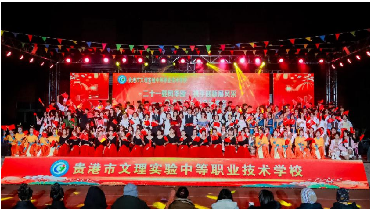
图 2.8.2-2：2024 年 12 月 26 日，开展“二十一年风华颂 携手迎新展风采”一贺校庆暨元旦文艺晚会