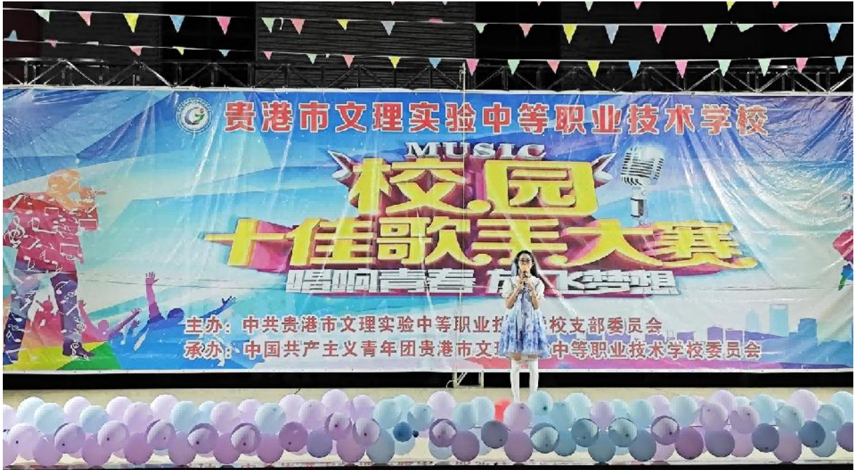
图 2.8.2-1：2024 年 9 月起，开展“校园十佳歌手”大赛