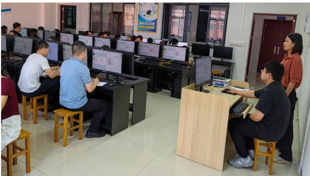
图 2.5-2：2025 年 5 月 21 日组织全体教师学习人工智能技术运用

学校坚持以“科研促教、科研兴校”为指导思想，扎实做好教科研工作，全面提高教师教科研水平，推进教育教学质量稳步提升。学校将科研纳入到教育教学工作中，鼓励教师们从自身的工作入手、深入学习教育理论，广泛开展研究活动，切实提升自身专业素养。