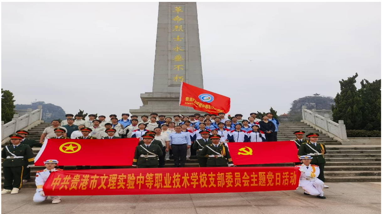
图 7-3：2025 年 3 月 28 日开展“缅怀革命先烈 赓续红色血脉共筑中华魂”为主题的清明祭扫活动