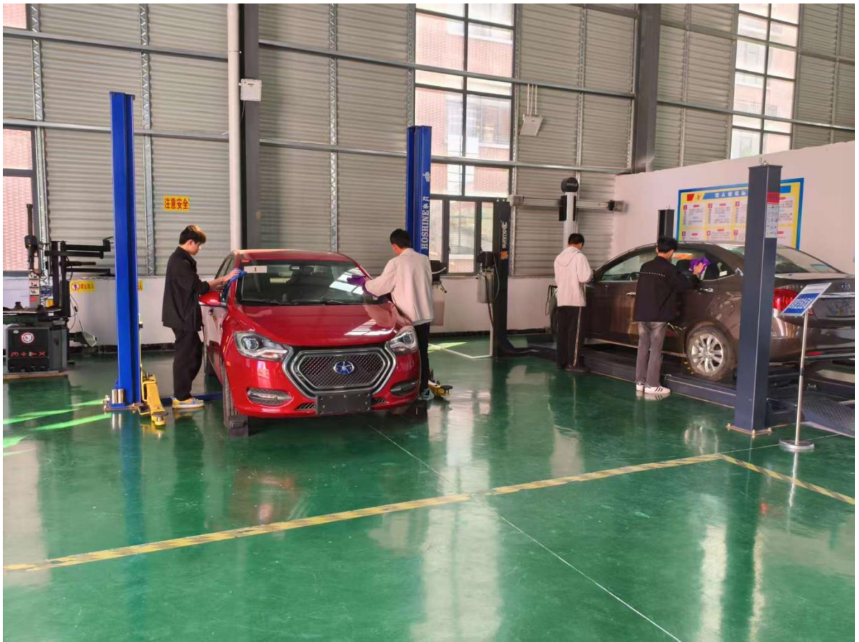
图 2.8.3-3：2025 年 3 月 25 日组织全校开展爱国卫生运动