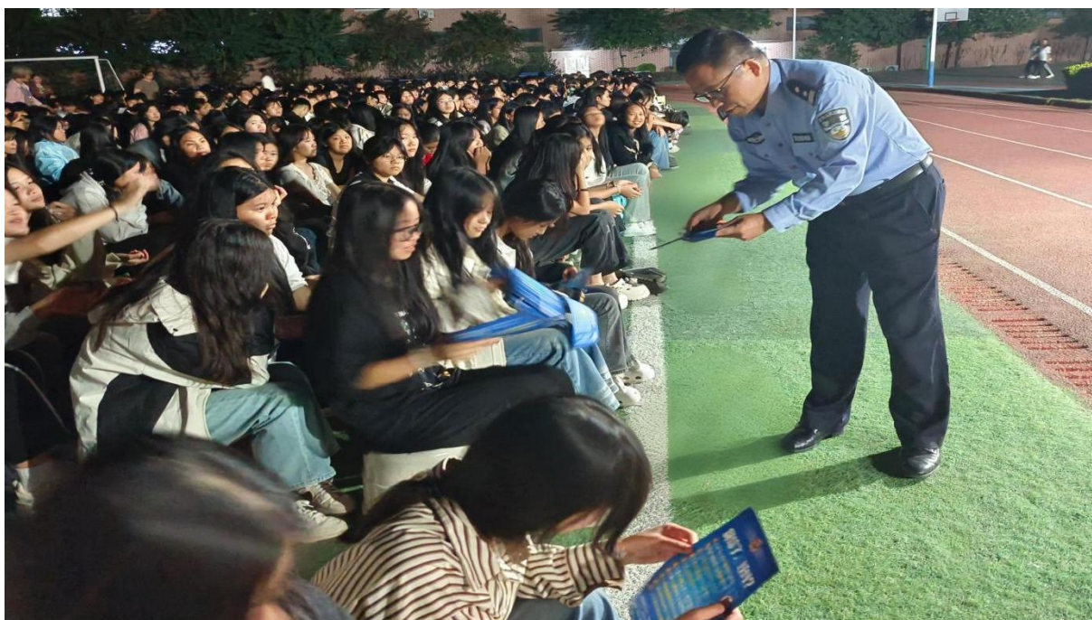
图 2.1-4：2024 年 11 月 5 日法制教育——反诈、涉诈进校园等专题讲座活动