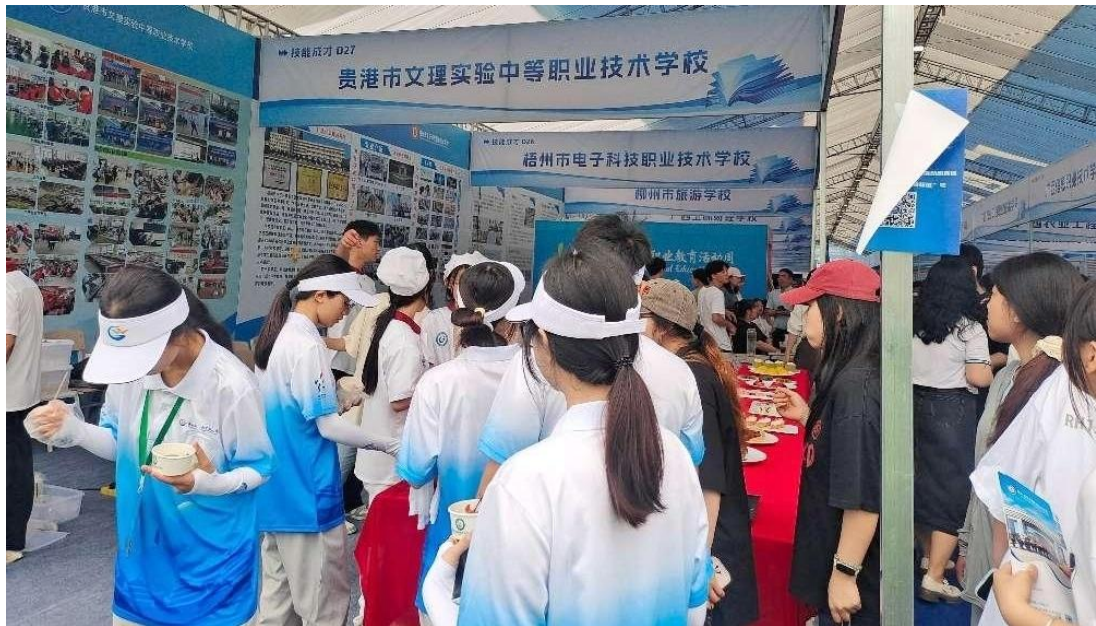
图 3.2-1：2025 年 5 月 14 日我校参加广西职业教育活动周