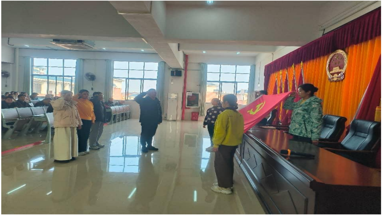
图 7-2 入党宣誓仪式