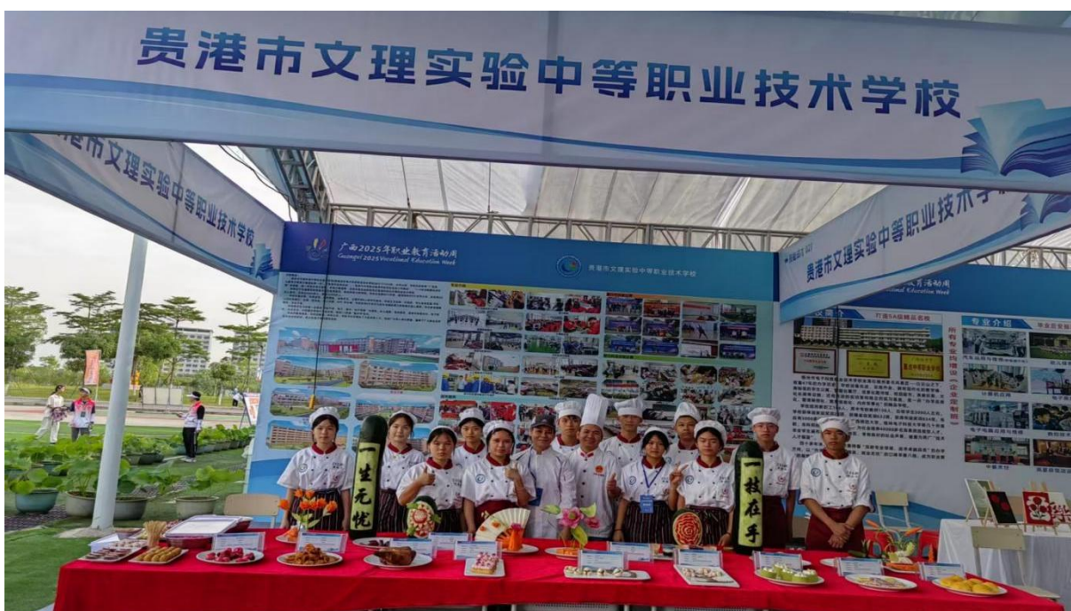
图2.1-15：2025年5月14-20日开展主题为“一技在手，一生无忧”职业教育周活动