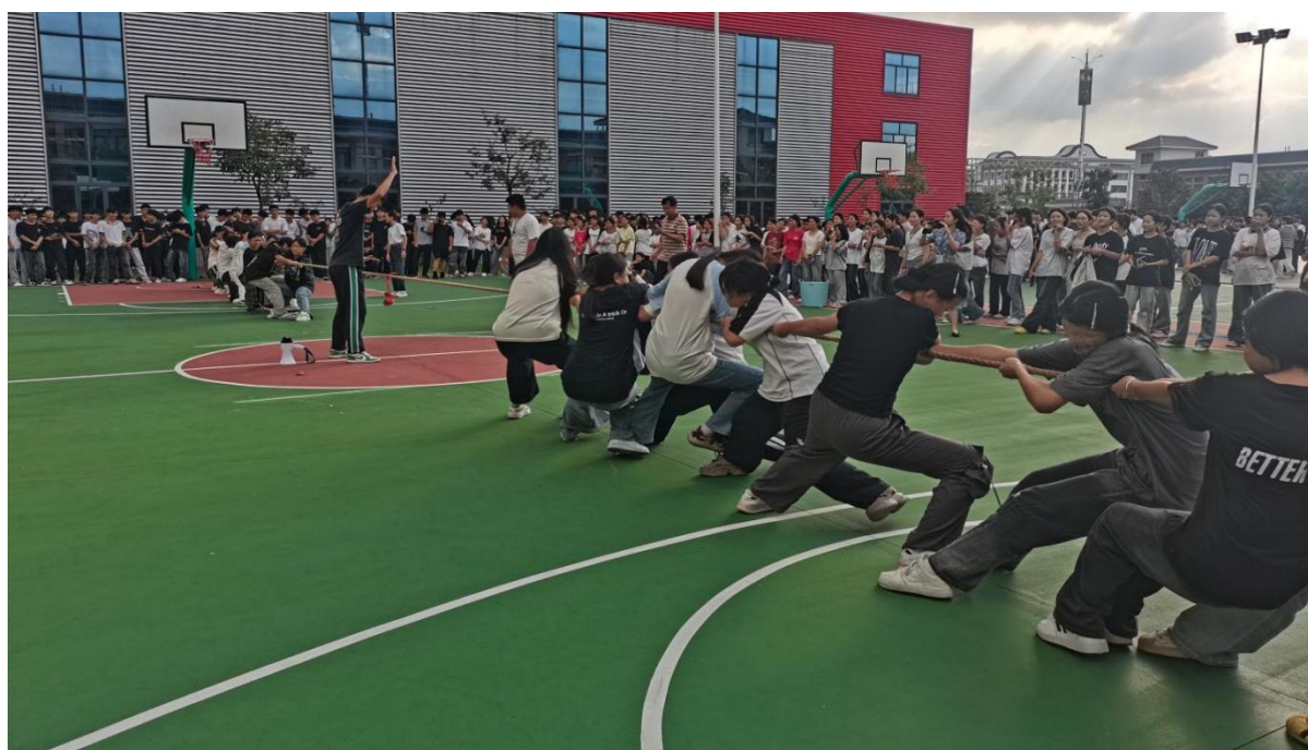
图 2.8.1-2: 2024 年 9 月——10 月, 开展新生杯体育赛事活动