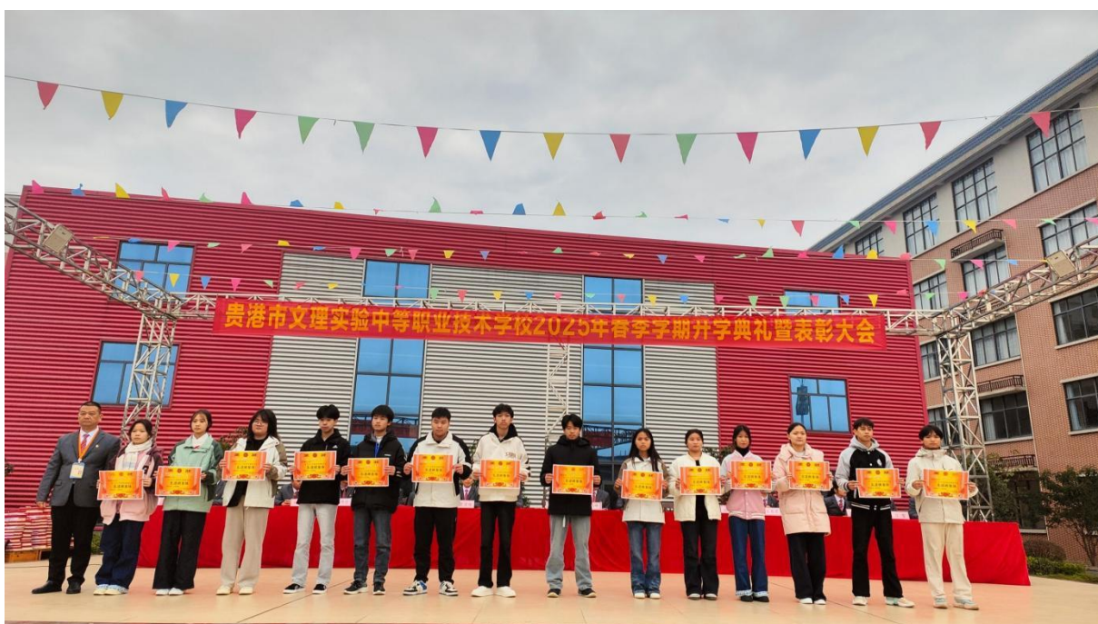
图2.1-9：2025年2月24日举行“春早远航扬帆起 齐心协力绘新篇”春季学期开学典礼